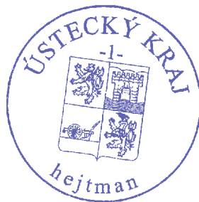
Ing. Jan Schiller

Nahlédnout do podkladových materiálů pro 10. zasedání Zastupitelstva Ústeckého kraje v VI. volebním období 2020 - 2024 bude možno v průběhu tohoto zasedání v konferenčním sále Krajského úřadu Ústeckého kraje na místě označeném „SERVIS“. Podkladové materiály pro 10. zasedání Zastupitelstva Ústeckého kraje v VI. volebním období 2020 - 2024 budou zveřejněny na webových stránkách 7 dní před konáním zastupitelstva.