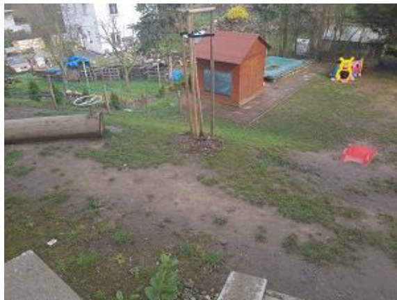
Foto č.3 antukové hřiště