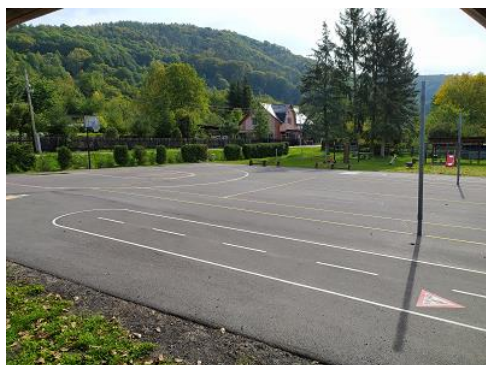
Foto č.1 dětské hřiště

Obec musí vytvářet kvalitní a finančně dostupné možnosti sportovního vyžití a aktivní zábavu všech generací, včetně občanů s omezeným pohybem.