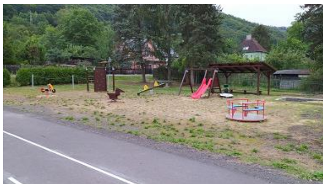
Foto č.2. dětské hřiště pod obecním úřadem