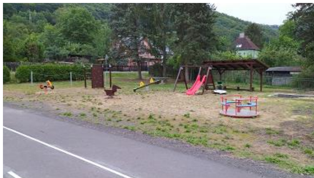
Foto č.2 dětské hřiště pod obecním úřadem