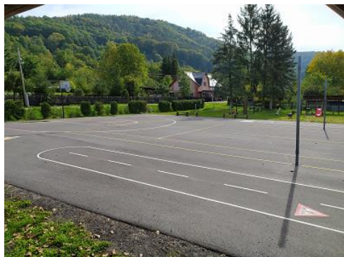
Foto č.1 dětské hřiště

Obec musí vytvářet kvalitní a finančně dostupné možnosti sportovního vyžití a aktivní zábavu všech generací, včetně občanů s omezeným pohybem.