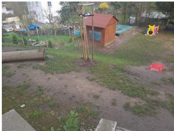
Foto č.3 antukové hřiště