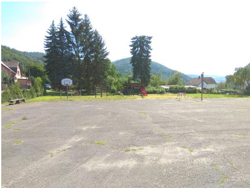
Foto č. 2. dětské hřiště pod obecním úřadem