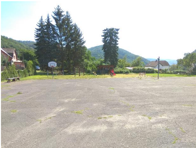
Foto č. 2. dětské hřiště pod obecním úřadem